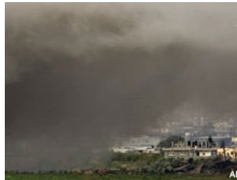
Israelische Panzer zerstören weiterhin die Tunnelanlagen der Palästinenser.

Beobachter hatten erwartet, dass Israel seine Offensive vor dem Machtwechsel bei seinem mächtigsten Verbündeten USA beenden wird. Barack Obama wird am Dienstag als Nachfolger von George W. Bush in das Amt des US-Präsidenten eingeführt.